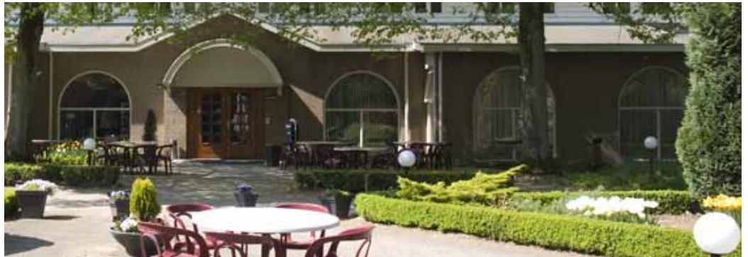
Conferentieoord De Poort in Groesbeek, locatie van de SE-opleiding.

De opleiding bestaat uit drie trainingsblokken per jaar van elk vier dagen. In het eerste jaar ligt de nadruk op de fysiologische basis van trauma en de effecten die een heftige gebeurtenis heeft op het autonome zenuwstelsel en op de hersenen. De studenten leren werken met hulpbronnen, de gevoelde ervaring in het lichaam en het herkennen van traumatische reacties. In het tweede jaar ligt de focus op de verschillende vormen